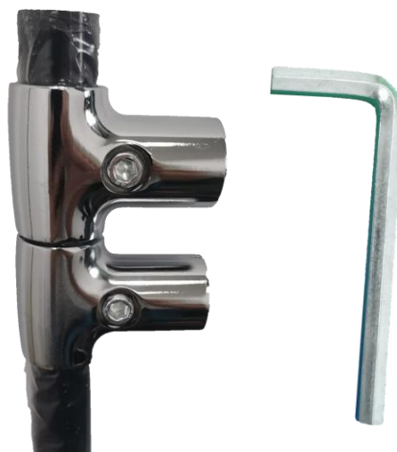
金属固定夹及六角扳手