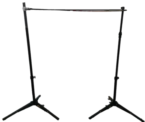
水平圆门安装效果图